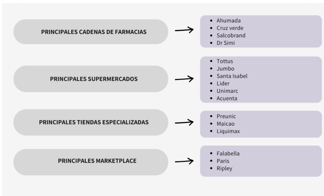
FIGURA N°2: TIPOS DE COMERCIOS Y PROVEEDORES.

A continuación, se detalla el tipo de comercio y los proveedores considerados en cada uno de los casos 7 .