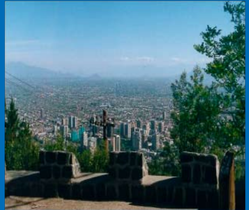
Cerro San Cristóbal

Sector Tupahue. El descenso a pie desde la Estación Tupahue ofrece una variedad de vistas