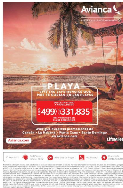
Figura 1. Anunciante: Avianca. Medio: Diario La Tercera. Fecha de difusión: 28-03-2017