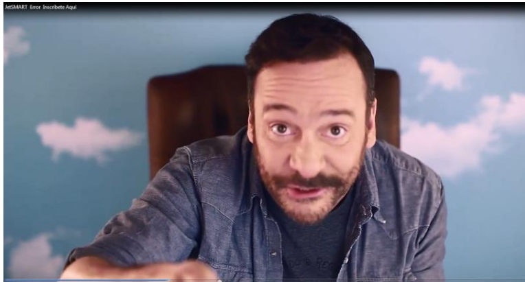
Figura 3. Anunciante: Jetsmart Medio: Youtube. Fecha de difusión: 30-06-2017

El precio informado no es el que efectivamente pagará el consumidor y por tanto no podrá ser comprobado, dado que no es real.